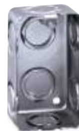
CAJA RECTANGULAR F.G.