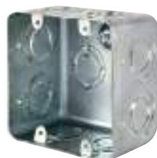
CAJA DE PASE CUADRADA